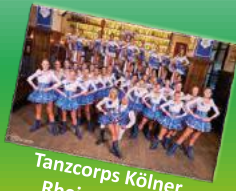
Tanzcorps Kölner Rheinveilchen