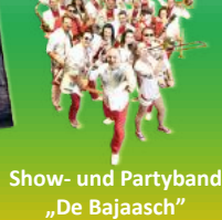
Show- und Partyband „De Bajaasch“